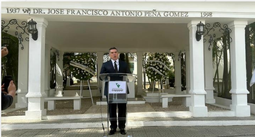
Nuestra Conferencia rindió un merecido homenaje a la figura del gran demócrata dominicano José Francisco Peña Gómez