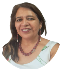
Ximena Rivillo Oróstica Presidenta COPPPAL Mujeres

América Latina y el Caribe viven momentos de grandes quiebres y amenazas. Pero también de esperanza. Una esperanza que nace de la historia de nuestros países, por sobreponerse permanentemente a la adversidad.